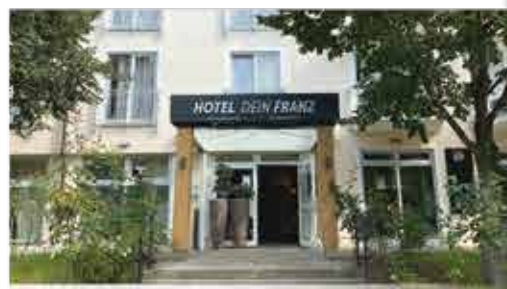
3+ Hotel Dein Franz

Freizeit/Kur/Unterhaltung: Die hauseigene Physiotherapiepraxis bietet Ihnen gegen Aufpreis erholsame und wohltuende Anwendungen. Oder Sie nutzen den Fahrradverleih (gg. Gebühr) im Hotel, um das herrliche Rottaler Bäderdreieck aktiv zu erkunden.