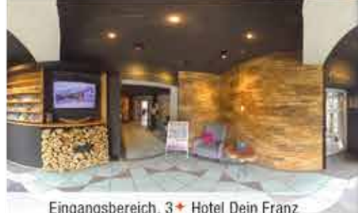
Eingangsbereich, 3+ Hotel Dein Franz