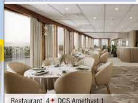
Restaurant, 4+ DCS Amethyst 1