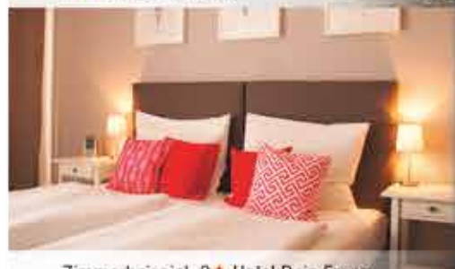
Zimmerbeispiel, 3+ Hotel Dein Franz