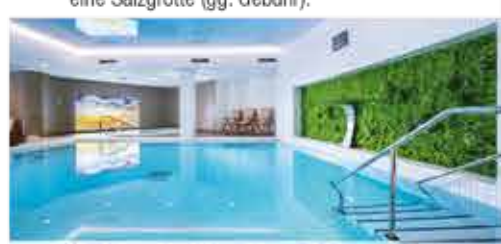
Schwimmbad, 4+ Resort Reitenberger

Freizeit/Kur/Unterhaltung: Das Resort besitzt eine Kurabteilung mit Schwimmbad (9 x 6 m, ca. 29°C), Whirlpool, Saunabereich mit Dampfbad und einem Fitnessraum (kostenfrei außerhalb der Therapiezeiten). Zudem verfügt das Haus über eine Salzgrotte (gg. Gebühr).