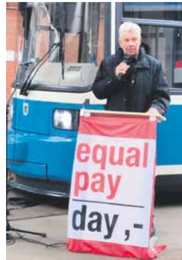
Der Oberbürgermeister Dieter Reiter eröffnete die Aktion.

Weitere Informationen und die Beratungstermine gibt es unter: www.beratungsstelle-barrierefreiheit.de .