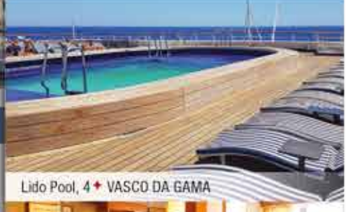
Lido Pool, 4+ VASCO DA GAMA