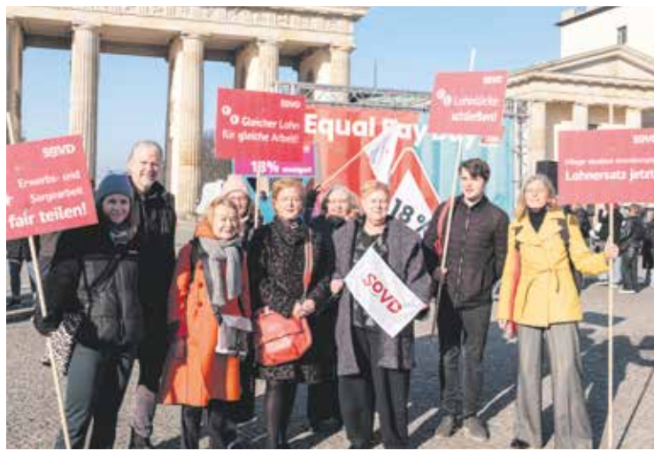
18 Prozent Lohnlücke – der SoVD fordert wirksame Maßnahmen.

Ein riesiges Verkehrsschild mit 18 Prozent Gefälle symbolisierte