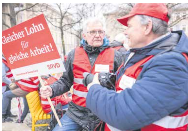
Auch zahlreiche Männer waren unter den Teilnehmenden der Aktion und unterstützten die Forderungen.