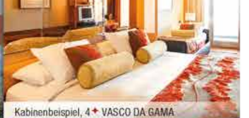
Kabinenbeispiel, 4+ VASCO DA GAMA