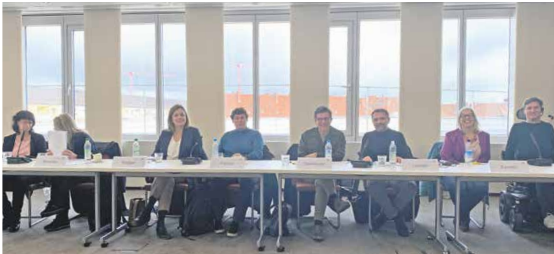
Das Berater*innenteam der Fachstelle Barrierefreiheit stellte sich vor.

Sondersitzung des Landesbehindertenrates zum Stand der Barrierefreiheit