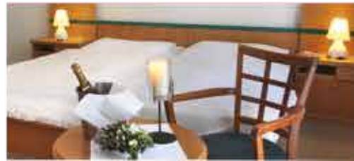
Zimmerbeispiel, 3+ Hotel Maxim

Freizeit/Kur/Unterhaltung: Der Komplex verfügt über einen eigenen Kurbereich, in dem alle gängigen Kur-Anwendungen geboten werden. Des Weiteren steht Ihnen das Schwimmbad (8 x 4 m, ca. 29°C) außerhalb der Therapiezeiten zur Verfügung.