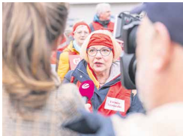
Redakteur*innen von Sat.1 regional und NDR sprachen mit den Demonstrierenden über ihre Erfahrungen mit der Lohnlücke.